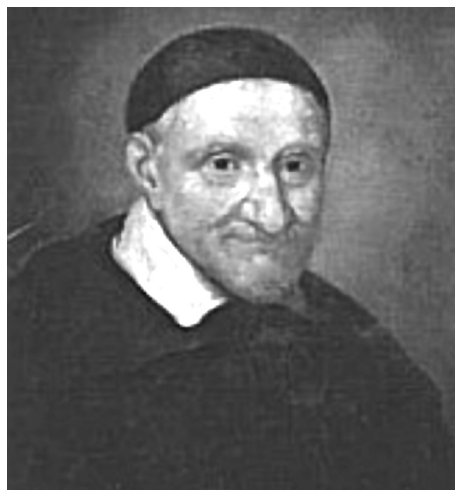
San Vicente de Paúl

Orden religiosa fundada en 1633 por San Vicente de Paúl y Santa Luisa de Marillac. Por su dedicación a los más pobres, a los enfermos y a los abandonados, San Vicente quiso que gozaran de una gran libertad de acción y para ello evitó la clausura y el convento. Por esta razón, las hermanas no hacen votos definitivos sino temporales que se renuevan cada año. En sentido estricto sus miembros no conforman una congregación religiosa y de esta forma no tuvieron que someterse a la clausura. Se hallan extendidas por todo el mundo y desarrollan su actividad en los lugares más pobres y junto a los más necesitados, siendo queridas y apreciadas por su trabajo desinteresado en leproserías, hospitales, orfanatos y escuelas rurales (1).