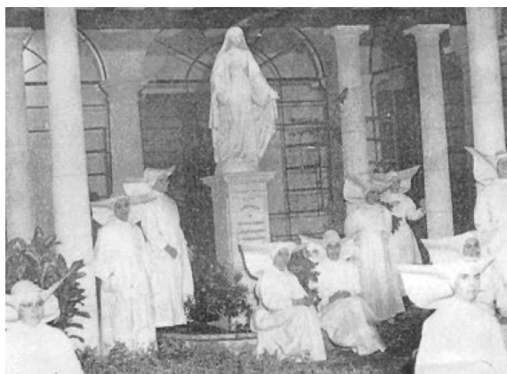
En el patio del hospital “La Milagrosa”

En el Hospital de Guanabacoa están desde 1886. Encontramos un documento donde se notifica la muerte de Sor Romualda Donamaria.