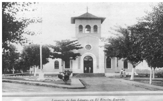
Hospital de San Lázaro